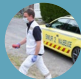
2 équipes SMUR